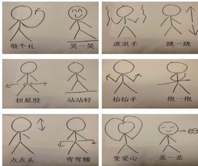
图2 《请你和我跳个舞》

如:活动《请你和我跳个舞》(见图2)在设计图谱的过程中,可以完全交给幼儿。大班的幼儿会和同伴协商:做什么动作、配什么歌词、动作如何做好看、谁来负责绘画,谁来负责编排动作,整个过程都是自主自由的,幼儿的想象力也可以得到充分的发挥,在创编设计后,请部分幼儿来表现展示自己的图谱设计以及他们根据图谱编排的歌舞,全体幼儿都可以去尝试这份独一无二的图谱动作,其他幼儿在活动后也有充足的时间可以来展示介绍自己的图谱以及动作。