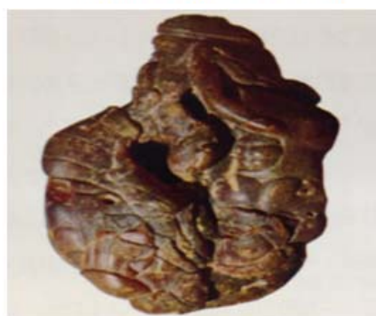
图4 琥珀森林之神与女人配饰