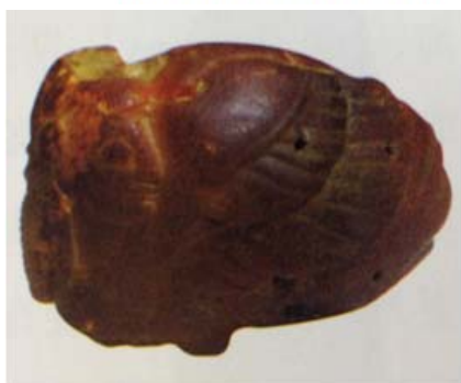
图3 琥珀斯芬克斯配饰